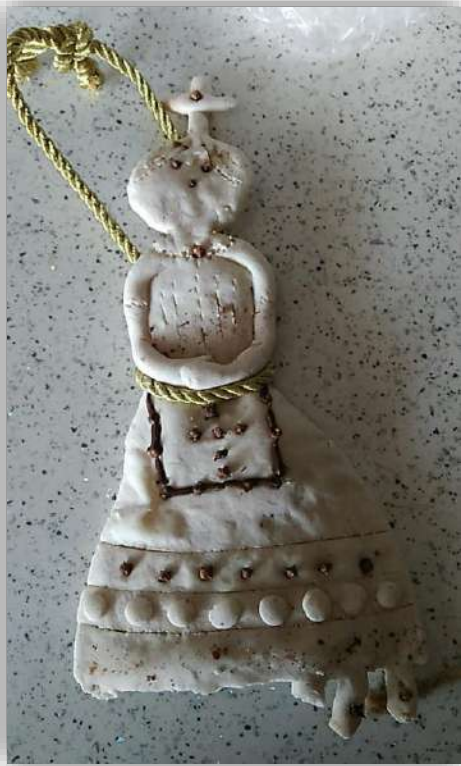
Η κυρα-Σαρακοστή και τα Λαζαράκια

Διά χειρός μαθητών Νηπιαγωγείου Λαγκάδας