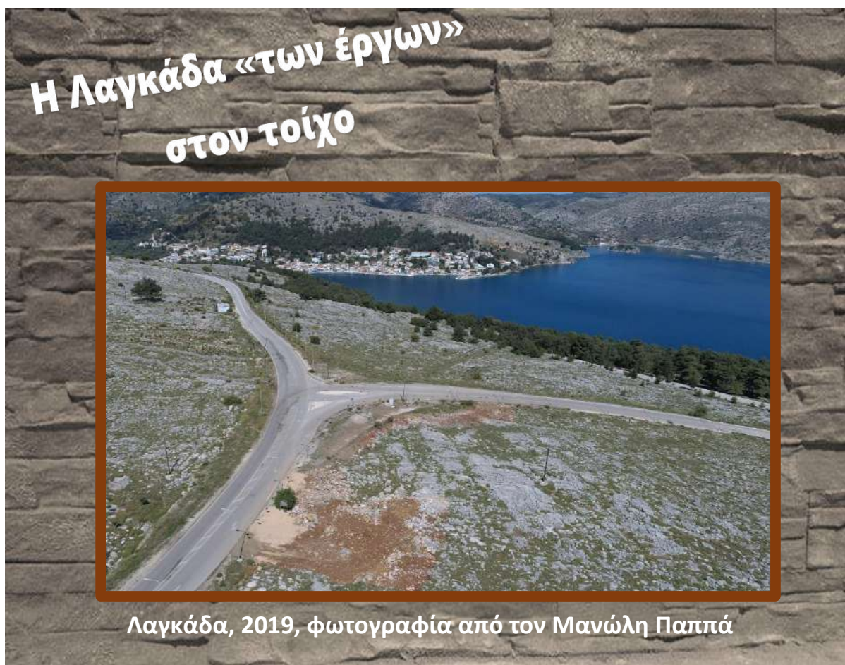
Λαγκάδα, 2019