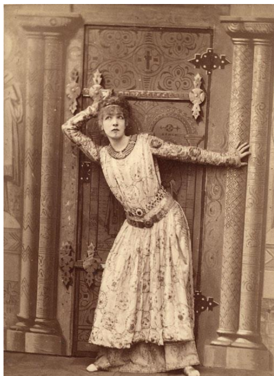
Η Σάρα Μπερνάρ στον ομώνυμο ρόλο της Θεοδώρας του Σαρντού το 1884

Όμως... ανανέωσα την γκαρνταρόμπα μου χωρίς να ξοδέψω φράγκο, γέμισαν τα συρτάρια μου μπλούζες και παντελόνια πουά μπατίκ από τις χλωρίνες, δικαιώθηκα με τα κομμένα φιλιά και τις αγκαλιές που από παιδάκι μου κάθονταν στο λαιμό και γλίτωσα από τα τρέχα απάνω - τρέχα κάτω του μιανού και τ' αλλουνού. Κι η μάνα μου είναι πιο περήφανη από ποτέ που αξιώθηκε, λέει, να με δει παστρικοθοδώρα.