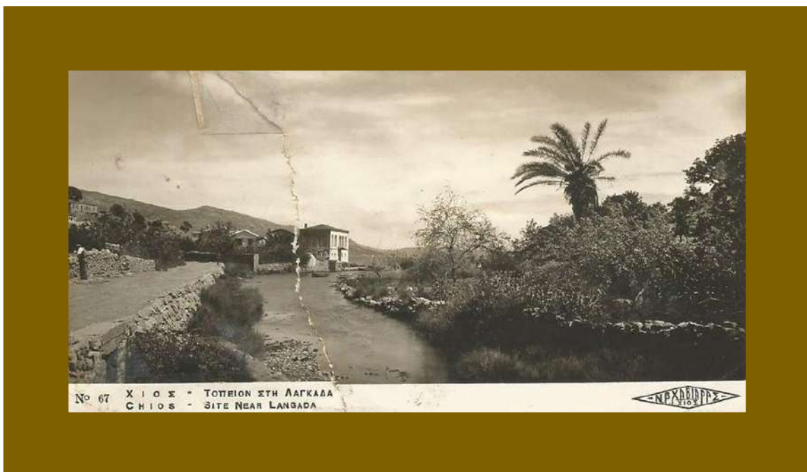
Ο Γλυφός, όπως τον γνώρισα

Αναρωτιέμαι αν έχει μείνει ακόμα τίποτα για χάλασμα ή τα διορθώσαμε όλα, προς το καλύτερο φυσικά, για το καλό το δικό μας και των απογόνων μας!