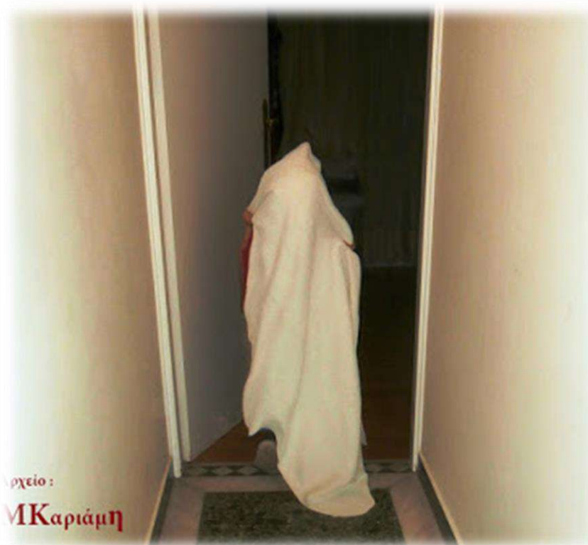
Η Σεντονού - μοντέλο του 2019

Με αυτές τις σκέψεις, ας κλειδώσουμε τα κάθε είδους φόβητρα στα χρονοντούλαπα της λαογραφίας. Ας διδάξουμε Αγάπη και ας παραδώσουμε στην κοινωνία Ανθρώπους Άφοβους, Ελεύθερους και Σκεπτόμενους. Είναι καθήκον και υποχρέωσή μας.