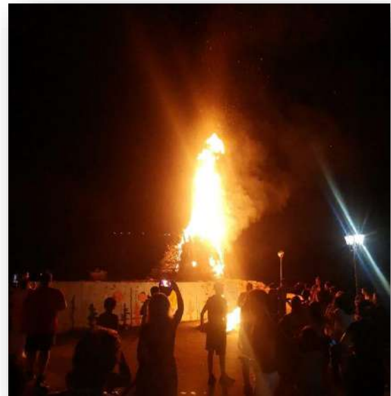
Είμαστε παράνομοι και φαινόμεστε